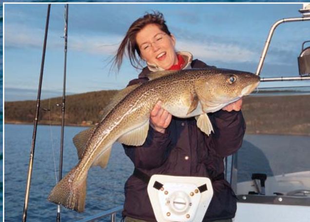
Welch Freude: Ein richtig guter Dorsch. Ganz sicher werden die lecker zubereiteten Filets großen Anklang finden.

Zanzibar Inn: Diese komfortable Anlage im Bezirk Fosen in Mittelnorwegen befindet sich direkt am Wasser und bietet alles, was das Anglerherz begehrt. Hier, im offenen Meer und in den idyllischen Fjorden, werden Sie Ihre Fischkisten füllen. Garantiert! Von JOACHIM EILTS