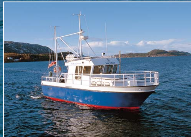
Auf der hochseetüchtigen „La Mar“, mit der auch Ausflüge unternommen werden können, haben zwölf Angler Platz.