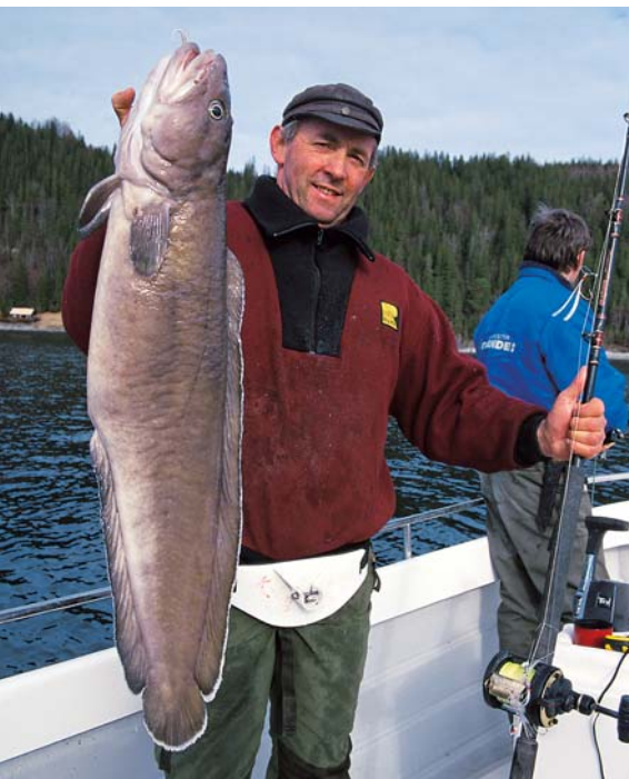
Ein schöner Lumb gefällig? In den Fjorden und in der See vor Lauvsnes sind die Fangaussichten hervorragend.