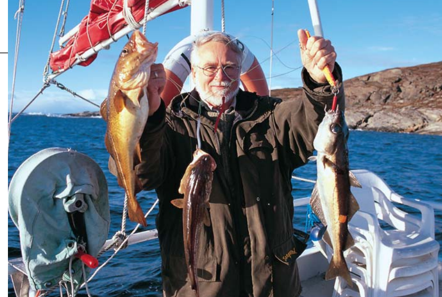
Eine alte Weisheit: Nicht gleich nach dem ersten Biss drillen, sondern noch etwas warten. Oft beißen weitere Fische.

angeln können, aber deshalb müssen Sie nicht die Flinte ins Korn werfen. In den Fjorden finden Sie immer eine ruhige Stelle. Wichtig ist das besonders für die Zeit von März bis Mai, wenn die Grobdorsche da sind, und während der Herbststürme.