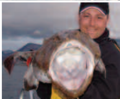
Diese Zeltplane heißt Seeteufel! Und mit 22 Pfund ein guter dazu.