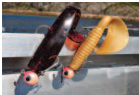
Gummitiere an Jigköpfen der 200-Gramm-Klasse: Da werden am E fjord Dorsch und Heilbutt schwach.