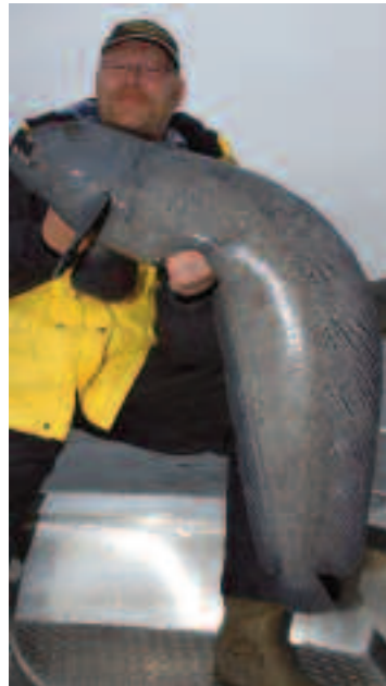
Starker Steinbeißer: Von April bis Juli am besten zu fangen.

Untiefen sind top Angelplätze, aber auch mit Vorsicht zu genießen.