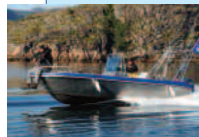
Schnelle und sichere Kvernø-Alu-Boote in 19 Fuß bringen Sie zum Fisch.

Anreise: via Flugzeug über Oslo nach Evenes (Entfernung Evenes-E fjord Sjøhus: 140 km)