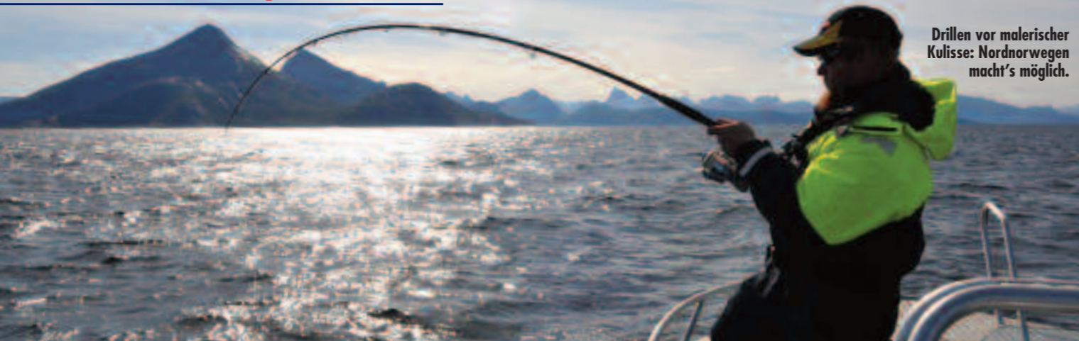
Drillen vor malerischer Kulisse: Nordnorwegen macht's möglich.