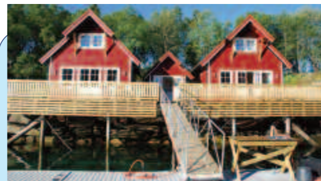
Zum Wohlfühlen: Zwei Ferienhäuser direkt am Wasser stehen für maximal ein Dutzend Angler zur Verfügung.