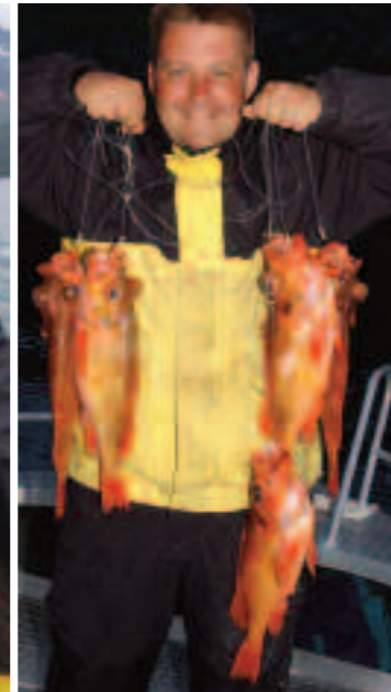
Fullhouse mit Rotbarsch: Freunde der stacheligen Leckerbissen kommen am Efjord auf ihre Kosten.