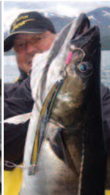
Taumelpilker verführten starke Seelachse.