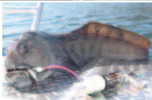
Beißen besonders gut, wenn reichlich Duft – wie hier im Futterkorbblei – mit angeboten wird: Steinbeißer.