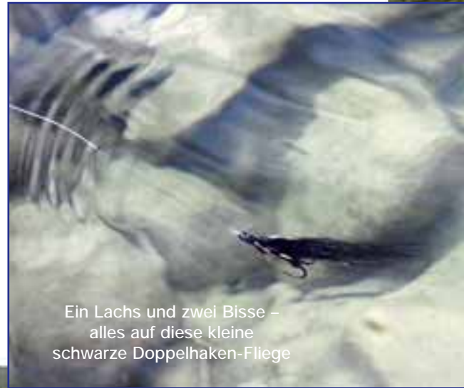
Ein Lachs und zwei Bisse – alles auf diese kleine schwarze Doppelhaken-Fliege

enorm unter die Flossen gegriffen, und heute erfreut sich der Beiarelva nicht nur eines enormen Meerforellenbestandes, sondern auch die Lachse sind wieder zurück. Ein Blick in die Fanglisten der vergangenen Jahre ist nicht unbedingt dazu geeignet, den Puls im Zaum zu halten. Alleine die Meerforellenfänge lassen einen sofort nach einem günstigen Flug nach Bodø suchen. So wurden im Jahr 2005 knapp 1900 Meerforellen gemeldet, in der Saison 2006 waren es knapp 1600. Nun muss man bedenken, dass die Norweger lange nicht jede Meerforelle melden, schon gar keine zurückgesetzten. Also liegt die Dunkelziffer um einiges höher. Die Spitzengewichte liegen bei zehn Kilo! Die 200 größten Meerforellen in