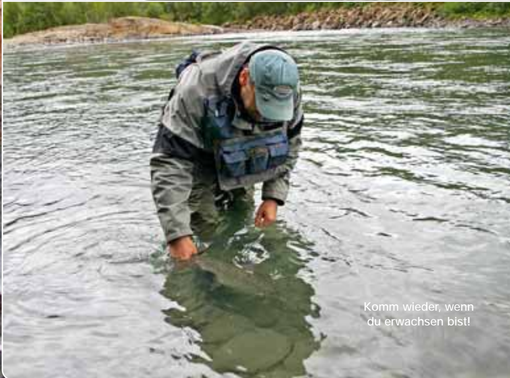
Komm wieder, wenn du erwachsen bist!

mit der Kamera in der Hand wie ein Steinmarder am Ufer entlanggehüpft. Inzwischen hatte ich den Fisch mit der Hand gelandet, ein leicht angefärbter Lachs von gut 5 Pfund. Mission erfüllt, Lachs gefangen. Was will man mehr, an einem unbekanntem Fluss nach kurzer Zeit einen Biss versemelt und einen Lachs gelandet. Gegen Abend bekam ich noch einen weiteren Biss, den ich aber nicht verwandeln konnte. Vielleicht war ich einfach zu müde und unkonzentriert. Als ich im Dunkeln zur gemütlichen Hütte direkt am Fluss zurückkam, hatte Terje schon etwas zu essen vorbereitet. Kaum saß ich am Tisch, als es an der Tür klopfte. Ein Einheimischer steckte den Kopf durch den Türspalt und fragte, ob er hier richtig sei. Er hätte gehört, hier sei ein Journalist zu Gast und er hätte einen schönen Lachs gefangen – ob wir den fotografieren möchten. Mit einem Satz war ich aus