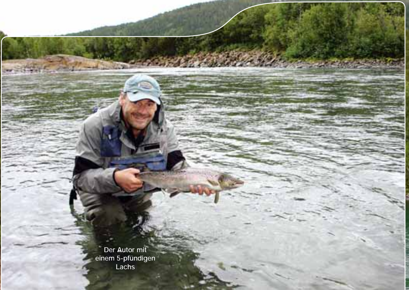
Der Autor mit einem 5-pfündigen Lachs